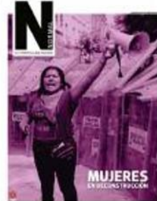
BUSCA EN INTERIORES SUPLEMENTO NORMAL

Avila Olmeda aclaró que las autoridades federales tampoco han pagado los permisos que solicitaron para habitar el lugar.